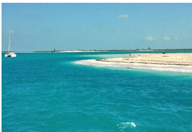
LAGOON 450 , L = 13,96m / B = 7,87m