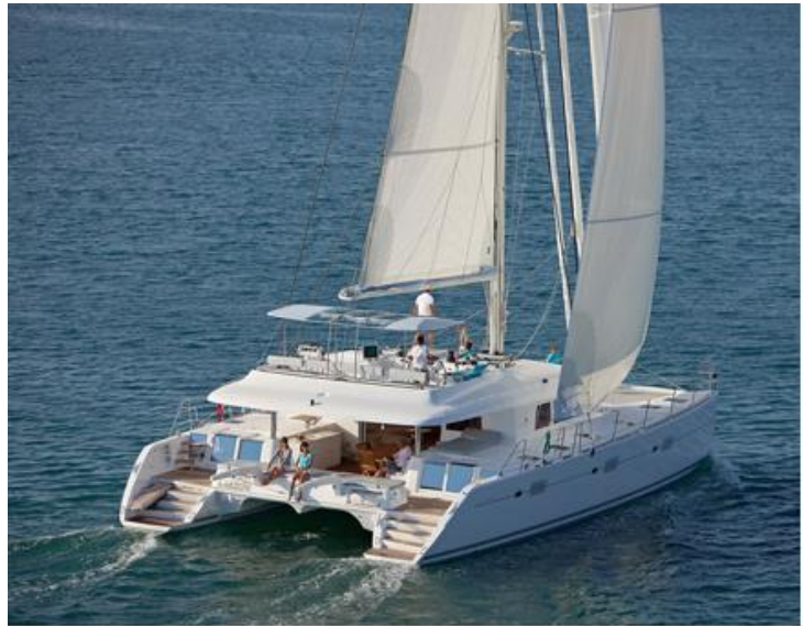
Lagoon 620 - Arrachen juni 2009 - Menton oblige/ore / Maristat

Wir erreichen nach dem Frühstück und einem 20-minütigen Schlag Sandy Cay, eine kleine mit Palmen gesäumte Insel und weißem Sandstrand oder je nach Wind kann es auch Sandy Spit sein, eine Trauminsel, wo wir den Vormittag verbringen bevor wir nach Cane Garden Bay segeln. Dinner an Bord und Nacht vor Anker.