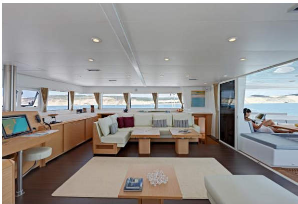
Lagoon 620 - Arrachen juni 2009 - Menton oblige/ore / Maristat

Frühe Abfahrt nach Gorda Sound, eine ruhige Bucht bei Virgin Gorda Island und Liverick Bay. Mittagessen in Prickly Island. Danach Schwimmen und Schnorcheln und ab ca. 16 Uhr legen wir ab, zurück nach St. Martin. Abendessen an Bord während der nächtlichen Überfahrt.